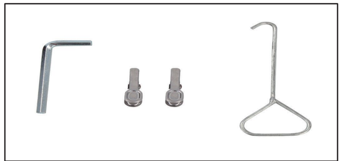
Værktøj Tool Bag